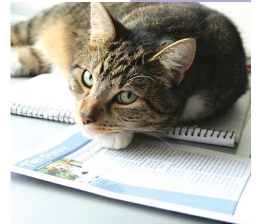
Kater Elvis versteht manchmal die Frauen nicht.

Eigenartig finde ich es auch, dass mein Frauchen es immer wieder schafft, mich zur Tierärztin zu schleppen, wenn ich mich gerade für mein Mittagsschläfchen gebettet habe. Tja, als Mann habe ich es eben nicht einfach mit den Frauen . . .