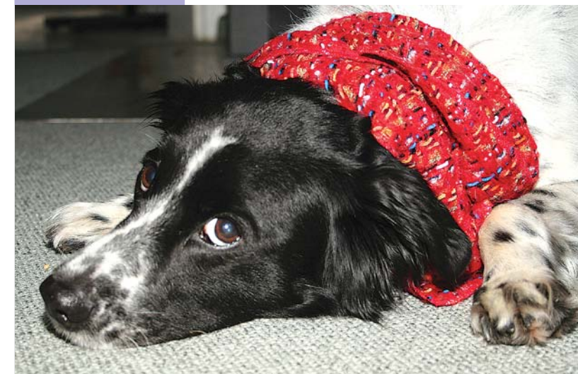
Scotty hat sich prompt eine Bronchitis eingehandelt.

Scotty schaut niedergeschlagen aus. Direkt zu Beginn der kalt-feuchten Jahreszeit hat der Rüde sich eine Bronchitis eingefangen. In den kom-