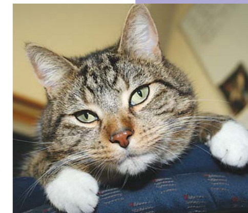
Kater Elvis ist ungern der Verlierer.