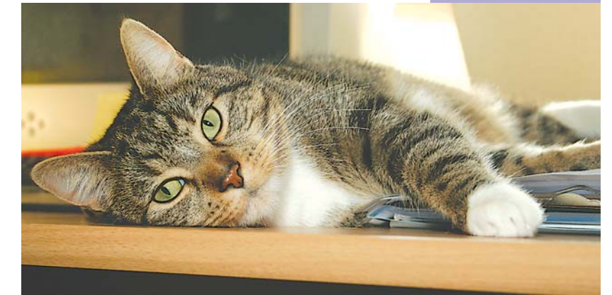
Kater Elvis lüftet das Geheimnis der Stangenbohne