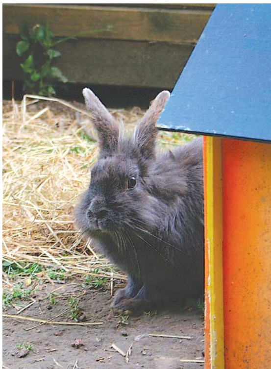
Kaninchen sollten geimpft werden, ganz gleich, ob sie im Außengehege oder in der Wohnung leben.

Eine Schutzimpfung gibt es ebenfalls gegen die „Chinaseuche“, eine hochansteckende Viruserkrankung, die u.a. über blutsaugende Insekten übertragen wird. Die Impfung hält ein Jahr vor. Gegen den Kaninchenschnupfen (Pasteurellose) gibt es auch einen Impfstoff. Dieser hält ein halbes Jahr vor. Fragen Sie Ihren Tierarzt!