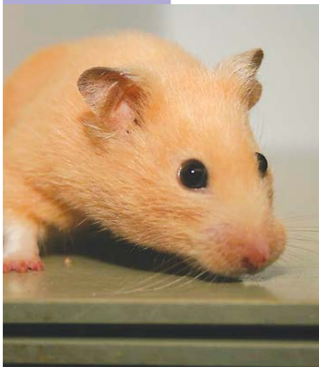
Mit ein bisschen Kühlung fühlen sich Hamster auch im Sommer wohl.

Bei großer Hitze sind Hamster träge und bewegen sich kaum. Hier sollten Sie die Fütterung ein wenig anpassen, d.h. mehr fettarme Getreidesorten, weniger Nüsse oder Kerne. Prima Durstlöscher sind Gurkenstücke und Salate. Kontrollieren Sie regelmäßig die Futtermittel Ihres Hamsters. Gerade im Sommer bilden sich bei hoher Luftfeuchtigkeit schnell Schimmel und Würmer.