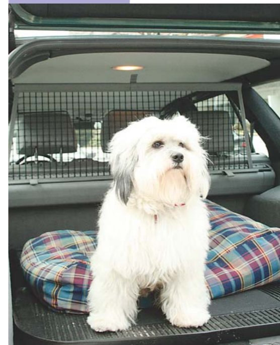
Tibeterrier Newton auf großer Fahrt. Die größte Sicherheit sollen Transportboxen bieten.