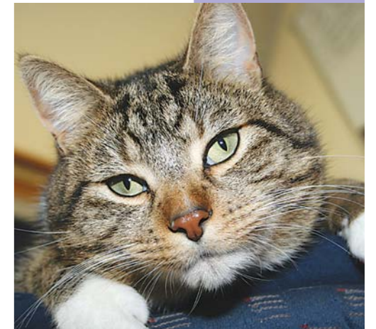
Kater Elvis liebt seine neue Katzenklappe.

Jetzt erlaube ich auch Frauchen, in Ruhe zu arbeiten. Als Pförtnerin war sie – unter uns gesagt – sowieso ganz miserabel . . .