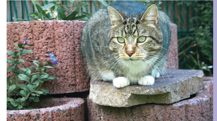
Kater Elvis hat einen neuen Beobachtungsposten.

Ach, was haben sich meine Menschen wieder einfallen lassen! Ganz geschäftig schleppten beide große Steine in den Garten. Hin und her haben sie diese Brocken geschoben. Mit Erde und Sand haben sie hantiert.