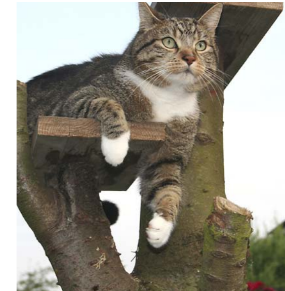
Kater Elvis hat einen neuen Hausgenossen.

Ein Eigenlob ist an dieser Stelle völlig angebracht. Als Kater kann ich mir das durchaus erlauben. Sie wissen ja, wir Katzen sind göttliche Wesen – jedenfalls behaupten das die Menschen. Jetzt hatte ich zumindest die Gelegenheit, meinen Menschen zu zeigen, wie gelassen ich sein kann: Mein Frauchen hat sich nämlich – aus Katzensicht – die größte Unverschämtheit erlaubt, die möglich ist: Sie holte eines dieser tolpatschigen Wesen ins Haus: einen Hund.