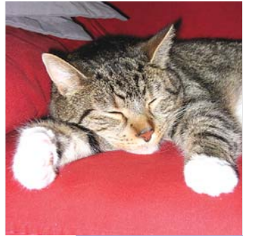
Kater Elvis hat zwei große Leidenschaften.

Kopfmassage, Brustmassage: das volle Programm! Entspannt liege ich auf dem Rücken im Arm meiner Herzensdame und die Welt ist wieder rund. Nach ein paar Minuten lasse ich sie auch wieder weiterarbeiten. Denn schließlich muss sie für mich ja noch möglichst viel Hühnchenfleisch verdienen . . .