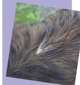
Eine Granne im Fell des Hundes. Doch oft kann der Tierhalter sie nur ertasten.