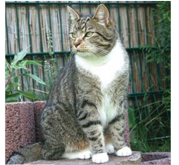
Kater Elvis hatte ungeliebten Besuch.

Unbemerkt habe ich mich ins Haus geschlichen. Leise bin ich durch die Katzenklappe gekrochen, habe den Napf links liegen lassen und bin direkt ins Büro gehuscht. In der Schale meines Kratzbaums habe ich mich verkrochen und so getan, als wäre ich gar nicht da.