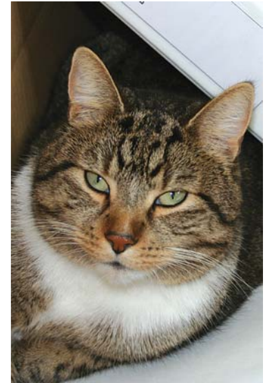
Kater Elvis hat eine neue Freundin.

Ganz langsam schleiche ich die Treppen hinauf. „Ob sie schon wach ist?“, frage ich mich, während ich eine Stufe nach der anderen erklimme. Das Treppenhaus ist dunkel. „Ob ich sie wirklich antreffe?“