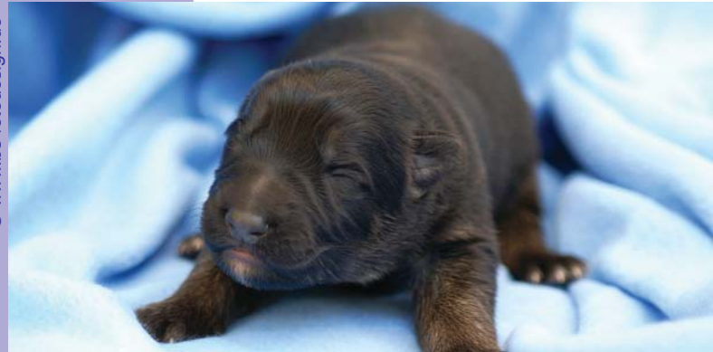
Wenn Sie sich für einen Welpen entscheiden: Handeln Sie überlegt und wenden Sie sich nur an anerkannte Züchter.

► Kaufen Sie auf gar keinen Fall dort, wo mehrere Rassen angeboten wer-