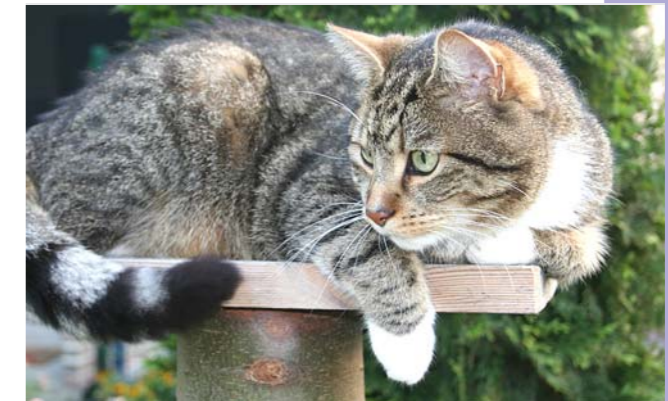
Kater Elvis beobachtet seine Menschen im Garten.

Wenn ich ein Mensch wäre, hätte ich an diesem Tag bestimmt ein breites Grinsen im Gesicht: Ich schaue in den Garten und entdecke ein komisches Szenario. Was ist das? Die Menschen in meinem Garten kenne ich, aber was um Himmels Willen treiben sie da? Mit Spaten, Harke und Eimern sind sie voller Tatkraft im Erdreich zugange.