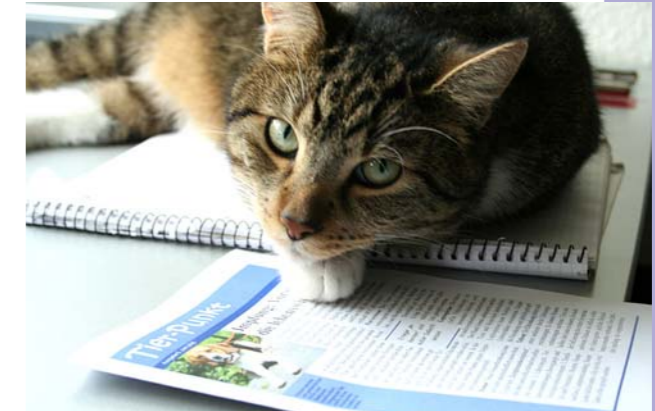
Kater Elvis ist noch häuslicher geworden.

Da ich bei einem größeren Ausflug von unserem unliebsamen Nachbarskater „vermöbelt“ worden bin und mich der Tierarzt erst einmal krank schreiben musste, war ich in meinem geliebten Garten einige Zeit nicht einsatzfähig.